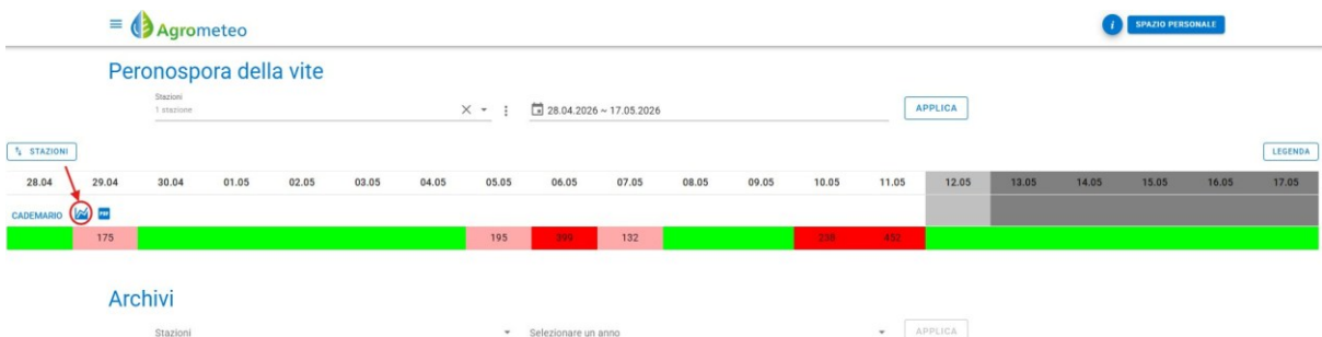
Fig. 2 – Accesso tramite il menu Viticoltura > Peronospora.

Nella barra di navigazione, cliccare su Viticoltura, poi selezionare Peronospora. Scegliere la/stazione/i e il periodo desiderato, poi cliccare su Applica. Cliccare sull'icona grafico accanto al nome della stazione per aprire il grafico Rischio.