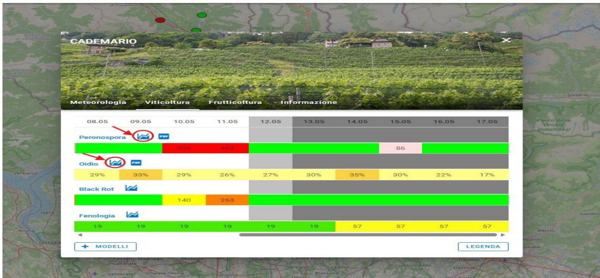
Fig. 1 – Accesso tramite AgroMaps: clic su una stazione, poi icona grafico Peronospora.

Dalla pagina iniziale di Agrometeo, cliccare sul punto di una stazione sulla mappa. Nella finestra che si apre, cliccare sull'icona grafico accanto a Peronospora.