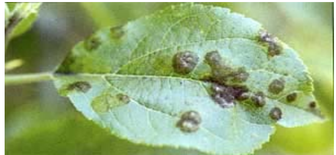
Schwache Virulenz der Infektionsherde auf dem Blatt einer wenig anfälligen Apfelsorte.