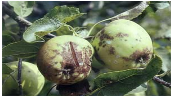
Bildung von Rissen auf der Apfelepidermis durch Frühschorfbefall.

Die saprophytische Phase entwickelt sich in den toten Blättern. Das Myzelium dringt in das Parenchym ein und bildet dann die Fruchtkörper für die sexuelle Vermehrung, die Perithezien. Dies sind birnenförmige Gebilde, welche braunschwarz sind und bei der Reife ungefähr einen Durchmesser von 0,1 mm aufweisen.