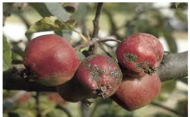
Schorfflecken auf jungen Äpfeln.