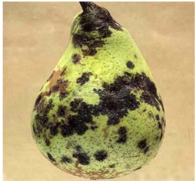
Schorfbefall auf Birne.

Die Schorfflecken dieser Primärfektion erscheinen nach einer Inkubationsperiode von 18 bis 25 Tagen je nach den Witterungsverhältnissen im Frühling. In der Folge werden eine grosse Zahl von Konidien gebildet. Diese werden durch Wasser (Regen, Tau) auf die benachbarten grünen Pflanzenorgane verfrachtet, auf welchen sie Sekundärfektionen hervorrufen. Diese neuen Infektionen werden ihrerseits wiederum Konidien bilden und freisetzen. Die Sekundärfektionen können sich daher, im Rhythmus der Regenfälle, während der ganzen weiteren Vegetationsperiode fortsetzen.