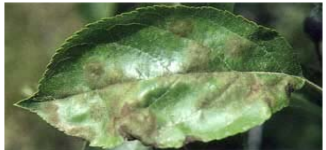
Schnelle Ausbreitung der Schorfinfektionen auf dem Blatt einer sehr schorfanfälligen Apfelsorte.